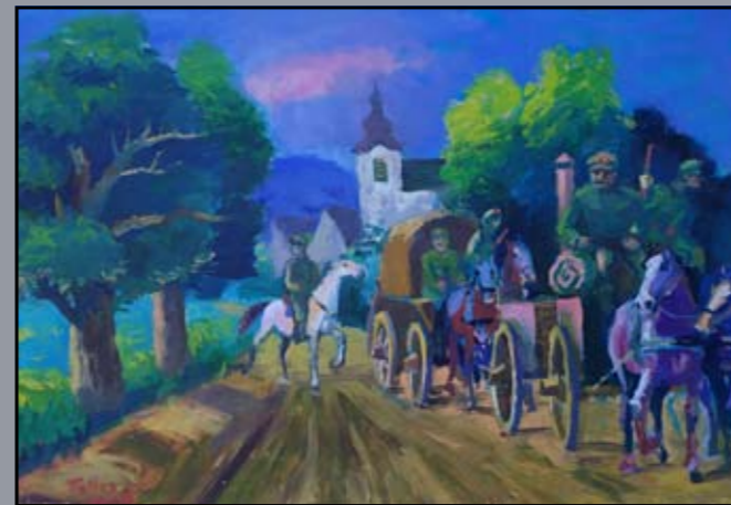
Óvatos vonulás 1958, olaj, karton