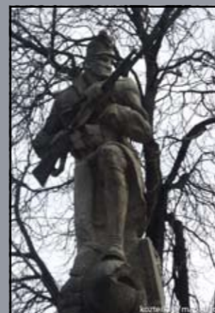
I. világháborús emlékmű Rajka