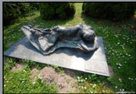
A mosonmagyaróvári Agrártudományi Egyetem 1956-os diákáldozatainak emlékműve