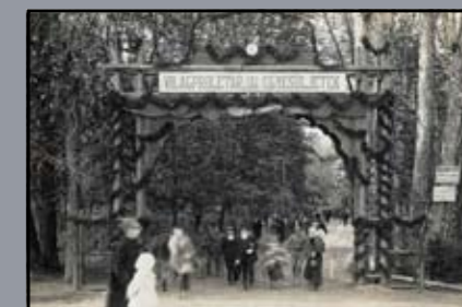
1919. május 1-i ünnepség a magyaróvári park bejáratával