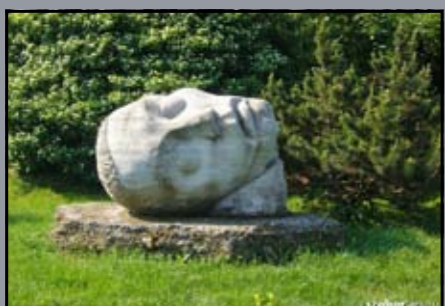
I. és II. világháború, a kitelepítés és 1956 áldozatai Hegyeshalom