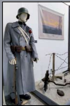
Első világháborús katona