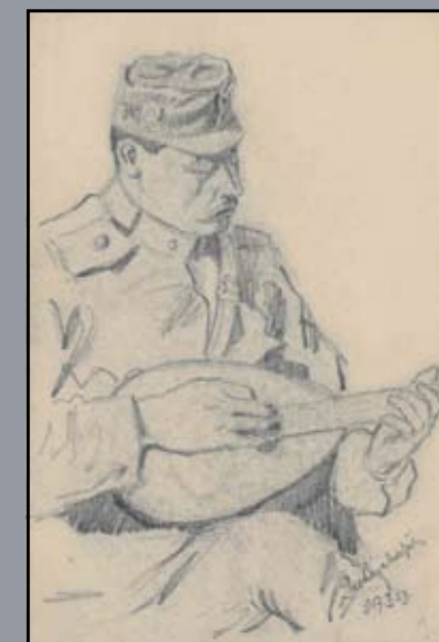
Mandolinon játszó katona 1917, papír, ceruza