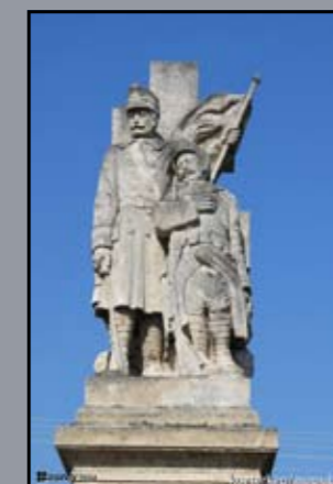
I. világháborús emlékmű Mosonszolnok