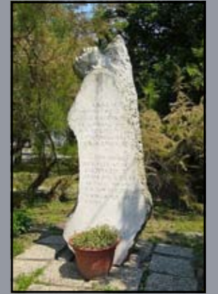
Kitelepítési emlékmű, Levél

◆ A magyar kormány 1947. február 10-én írta alá a II. világháborút lezáró békeszerződést Párizsban. Érvénytelenítették a korábbi területvisszacsatolásokat. Magyarország további sorsát a háborús vereség és a szovjet megszállás évtizedekre meghatározta. Szocialista országgént teljesen a Szovjetunió befolyása alá került.