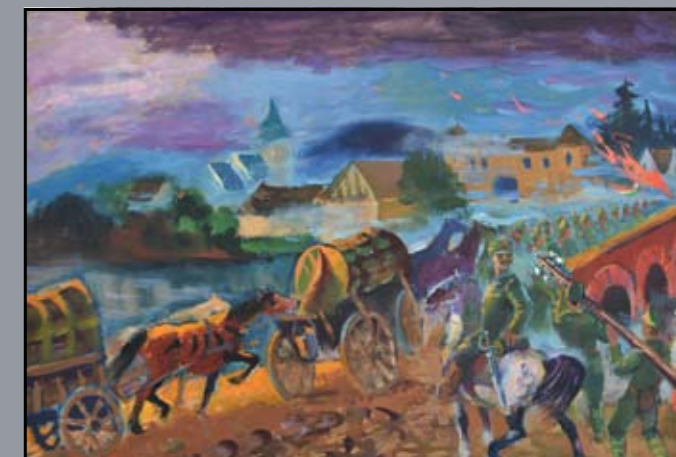
1919-es harci jelenet 1960, olaj, karton