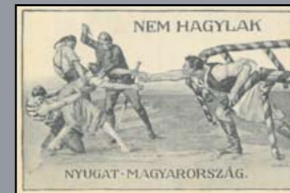
Képeslap a nyugat-magyarországi felkelésről

◆ 1921. december 14-16. között tartották a soproni népszavazást, melynek eredményeként Sopron és a környező nyolc település Magyarország része maradhatott. Ez volt a trianoni békeszerződés egyetlen komolyabb területi revíziója, melyet a nagyhatalmak tartósan elfogadtak.