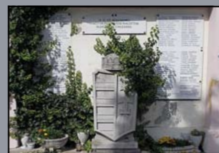
Hősi emlékmű a Hősök kápolnája falán