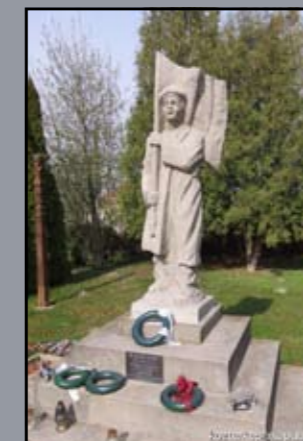
Pesti srác Lébény