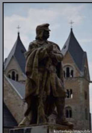
I. világháborús emlékmű Lébény