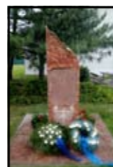
Kitelepített németek emlékműve Rajka