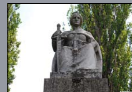
Hungária I. világháborús emlékmű