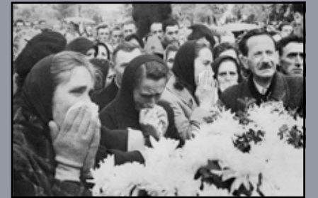
Gyászoló családtagok a sortűz áldozatainak temetésén