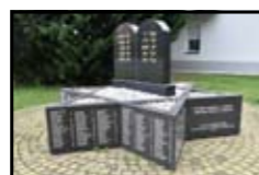
Magyaróvári járás zsidó áldozatainak emlékműve Mosonmagyaróvár