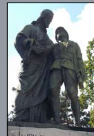
Mosoni hősi emlékmű