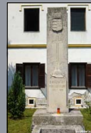
I. világháborús emlékoszlop Levél