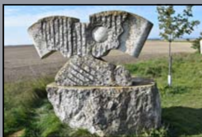
Szoborpark Rajka határában