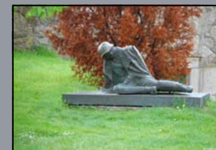
A II. világháborúban hősi halált halt honvédek emlékműve