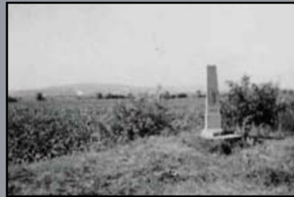
Trianoni hármás határ Köpcsény és Oroszvár között, 1941.