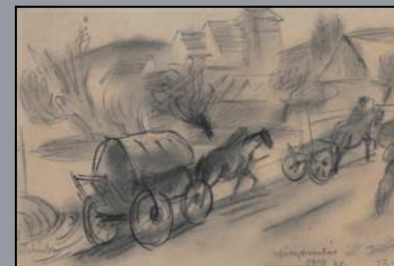
Előrenyomulás Csetneken át 1919, papír, fekete kréta