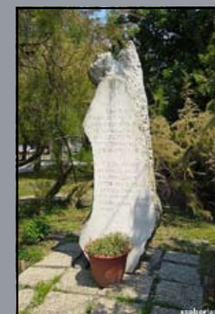
II. világháborús emlékmű Levél