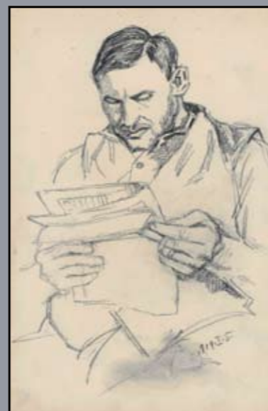
Újságot olvasó katona 1919, papír, fekete kréta