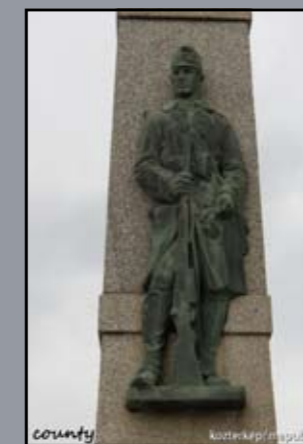
I. világháborús emlékmű Jánossomorja