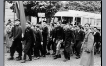
Iskoláskorú fiatalok felvonulása