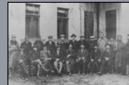
A magyaróvári direktórium tagjai 1919-ben

vörös terror: tágabb értelemben a kommunista mozgalom szimpatizánsai („vörösök”) által elkövetett nagyobb méretű, politikai indíttatású erőszakhullámot jelenti. Magyarországon, elsősorban a Tanácsköztársaság idején elkövetett atrocitásokat értjük alatta