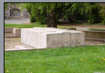
Gazdászok I. világháborús emlékműve