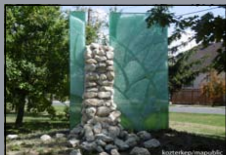
1956-os emlékmű Feketeerdő