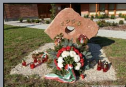
1956-os emlékmű Halászi