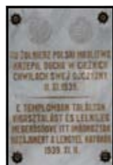
Lengyel menekültek emléktáblája Rajka