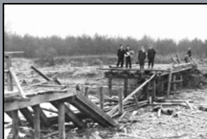
A felrobbantott andaui híd