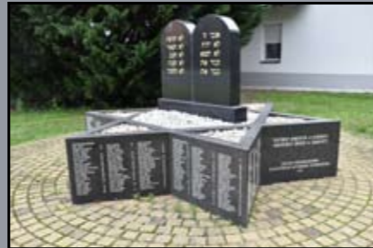
A magyaróvári járás zsidó áldozatainak emlékműve

◆ 1944 végétől az országot megszállva tartó németek és a hatalomra került nyilasok ellen harcoló szovjet csapatok fokozatosan elfoglalták Magyarország területét. A nagyvárosok közül a világháborúban Budapest ostroma volt az egyik legtovább tartó. A háború Európában 1945. május 8-án Németország feltétel nélküli megadásával fejeződött be.