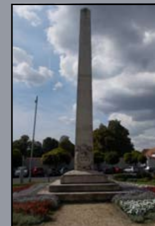
I. világháborús emlékmű