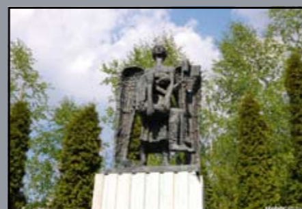
A II. világháború áldozatainak emlékműve Ásványráró