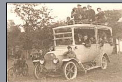
Rongyos Gárda harcosai