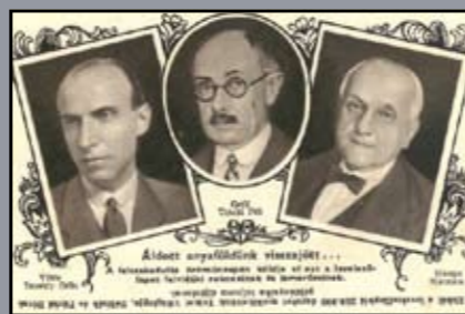
Felvidék visszatérése, képeslap, 1938.