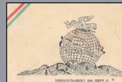
Üdvözlőlap, Erdély újra magyar föld, 1940.