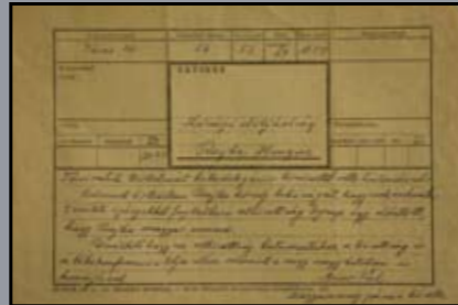
Távírat Párizsból 1947. augusztus 29.