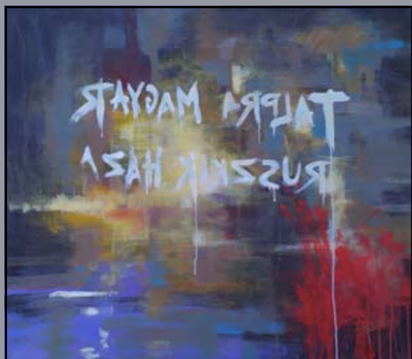
Juhász Tibor Kirakat '56 2006, olaj, vászon

◆ A mosonmagyaróvári Art Flexum Művészeti Társaság nemzetközi művésztelepén több alkalommal is készültek az 1956-os eseményekhez kötődő alkotások kortárs festők ecsetje nyomán, amelyeknek egy része szintén a Hansági Múzeum képzőművészeti gyűjteményét gazdagítja.