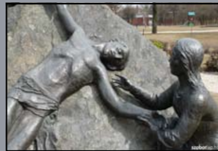
1956-os sortűz áldozatainak emlékműve