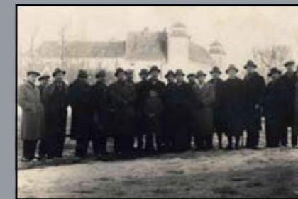
Lengyel menekültek és vendéglátóik a magyaróvári vár előtt

◆ Magyarország 1940-ben lépett be a háborúba Németország oldalán. Ugyanebben az évben született meg a második bécsi döntés, melynek értelmében Magyarország visszakapta Észak-Erdélyt. A németek követelésére Horthy csapatokat küldött az orosz frontra, de titokban tárgyalásokat kezdett a szövetségesekkel. Hogy megakadályozza hazánk átállítását, Hitler parancsot adott Magyarország megszállására. 1944. október 15-én Horthy sikertelen kiugrási kísérletét követően a magyar nyilasok (szélsőséges politikai párt) a németek támogatásával megszállták a fővárost és átvették a hatalmat. Vezérük, Szálasi Ferenc kormányt alakított és parancsot adott a magyarországi zsidóság elhurcolására.