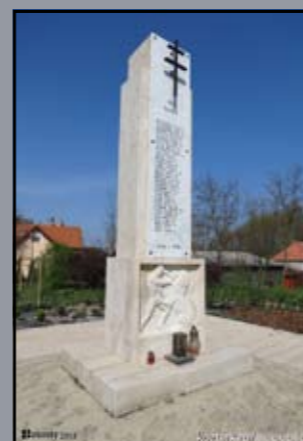
I. világháborús emlékmű Máriakálnok