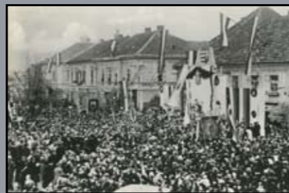
Felvidék visszatérése, 1938.

revízió: az országhatárok módosításának követelése, mint politikai cél. Az I. világháborút követő békekötések igazságtalanságának elismertetése, és az így kialakított országhatárok módosításának követelése