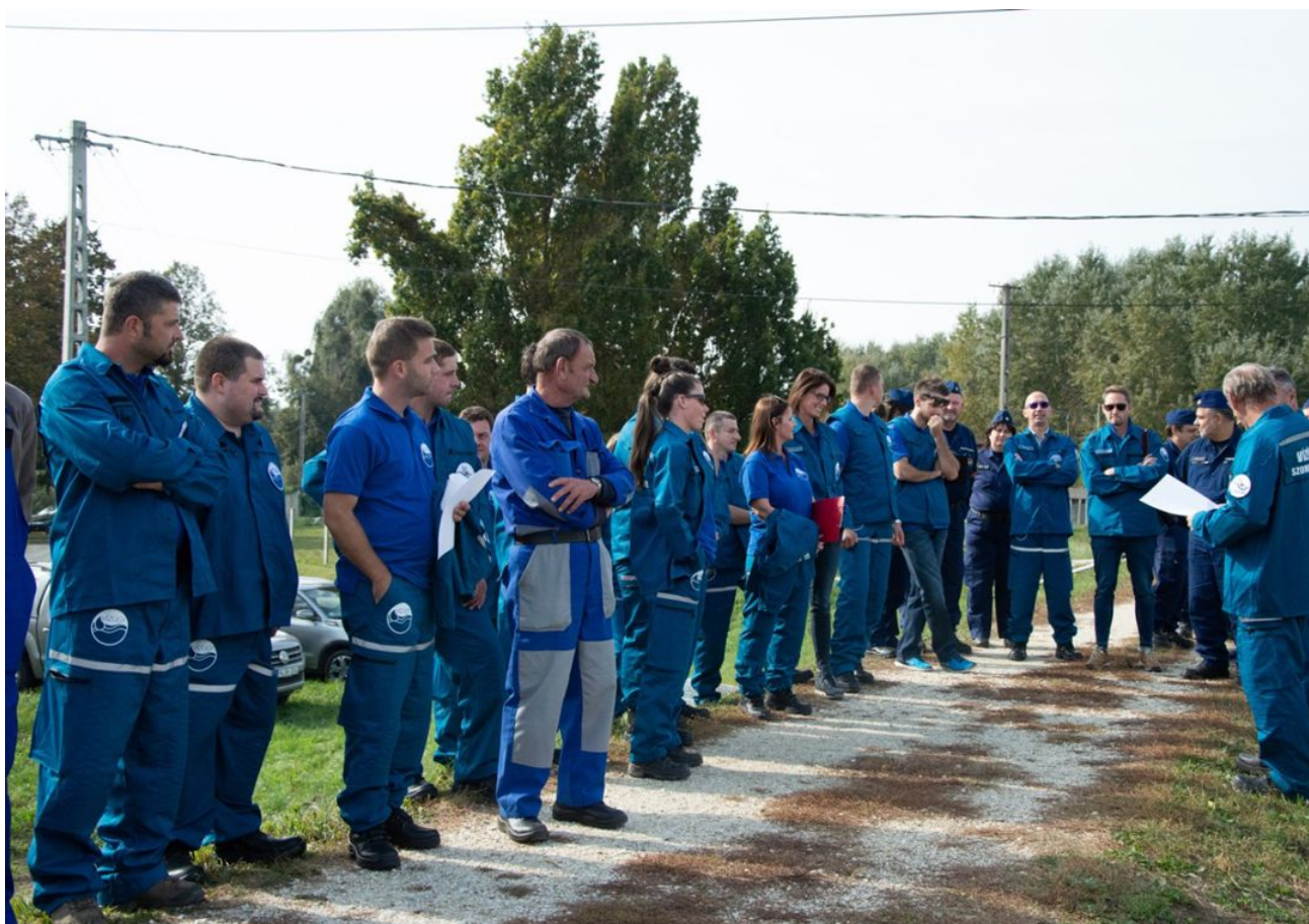
Feladatkiértékelés a védekezési gyakorlaton