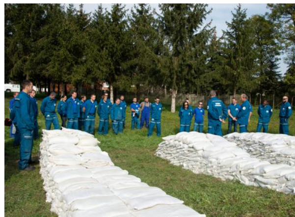
Bordás megtámasztás homokzsákokkal