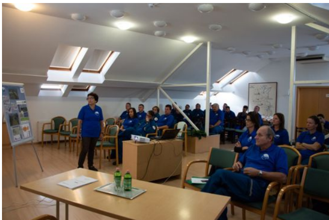
Oktatás az előrejelzésről

geometriai adatokkal való aktualizálással, és az elöntési területek valós idejű megjelenítésével.