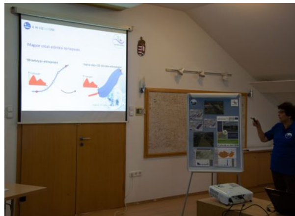
1D és 2D modellek működési elve

Megismerkedhettek a védelmi szervezet felépítésével, az Országos Műszaki Irányító Törzs feladataival, a vízkárelhárítás jogszabályi háttérével.