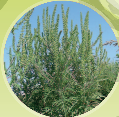
Virágzó növény (10 – 250 cm)

Az erősen fertőzött szántóföldekre többéves intézkedési koncepciót lehet kidolgozni