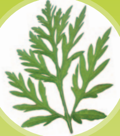
Tipikus parlagfű levél, alul és felül is zöld

Akár 60.000 magot és akár 8 milliárd pollenszemet is képes termelni!