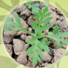
Fiatál parlagfű növény