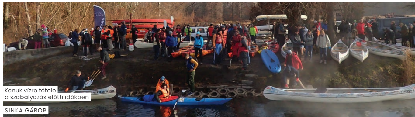
Kenuk vízre tétele a szabályozás előtti időkből

Hévíz alapvetően természetes termáلتaváról ismert. A tóból a Hévízi-csatornán elfolyó meleg víz különleges hangulatot teremt a téli időszakban, ami a vízitúra szervezők figyelmét is felkeltette. Az elmúlt években kialakult kaotikus állapotok kezelésére – a természet érdekében – meghozott szabályozók eredményei példaértékűek.