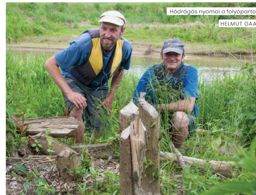
Hódrágás nyomai a folyóparton