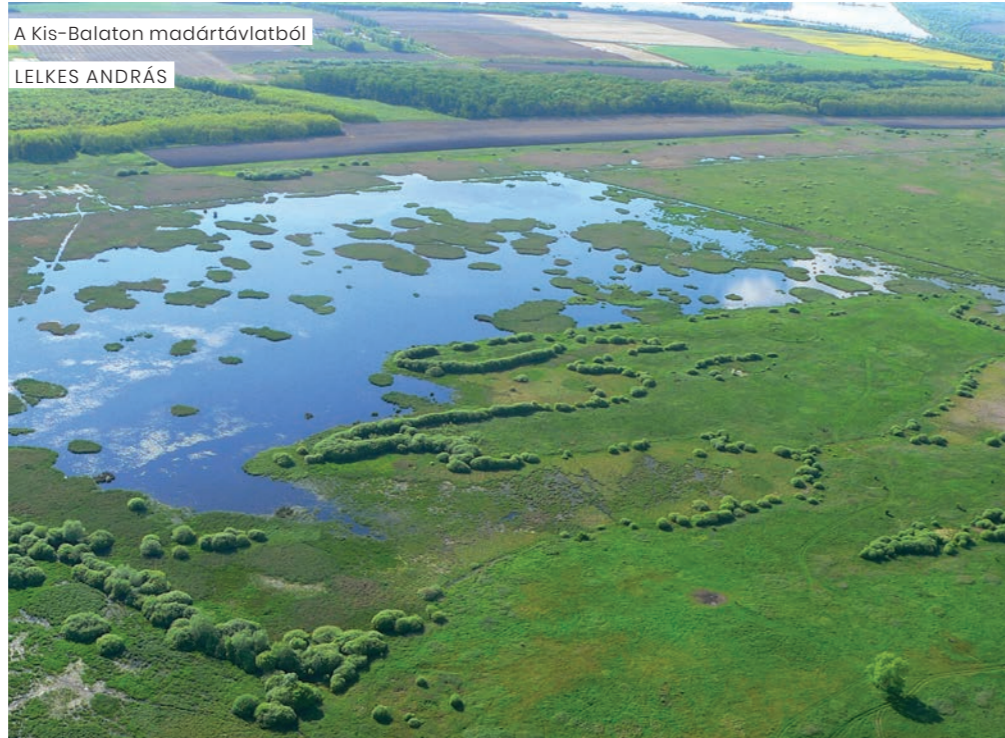
A Kis-Balaton madártávlatból

Gazdag a hínárnövényzet, a hatalmas kiterjedésű nádasok, gyékényesek, sásosok, mocsár- és láperdők mellett mocsárretek, kasszálórétek, valamint bokorfüzesek, fűz-nyár ligetek, égeresek és tölgyesek a jellemzők.