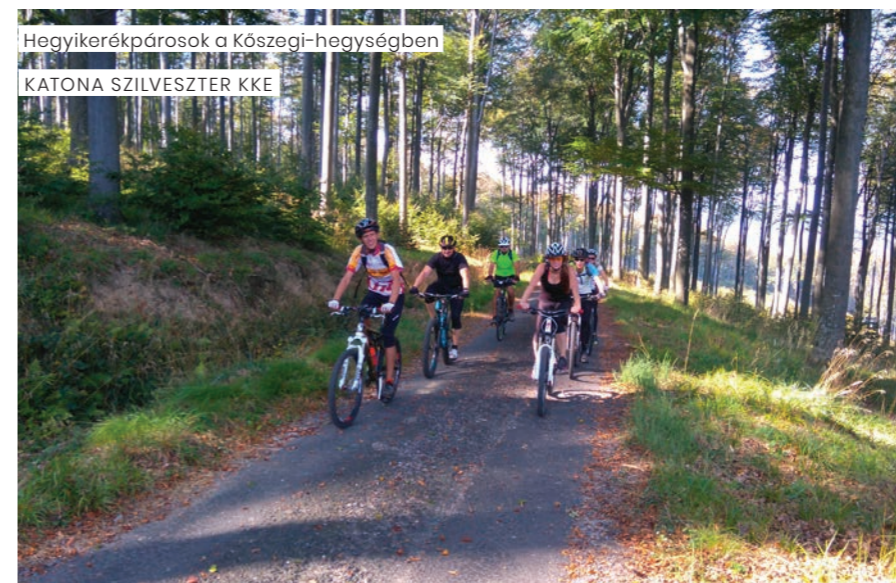
Hegykiékpárosok a Kőszegi-hegységben