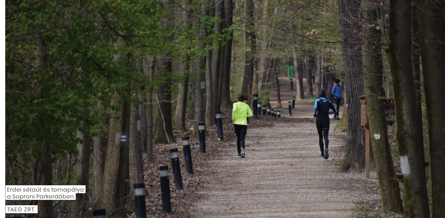
Erdei sétaút és tornapálya a Soproni Parkerdőben

Arról, hogy mindezeket a szabályokat és tilalmakat betartsuk, a megfelelő felügye-