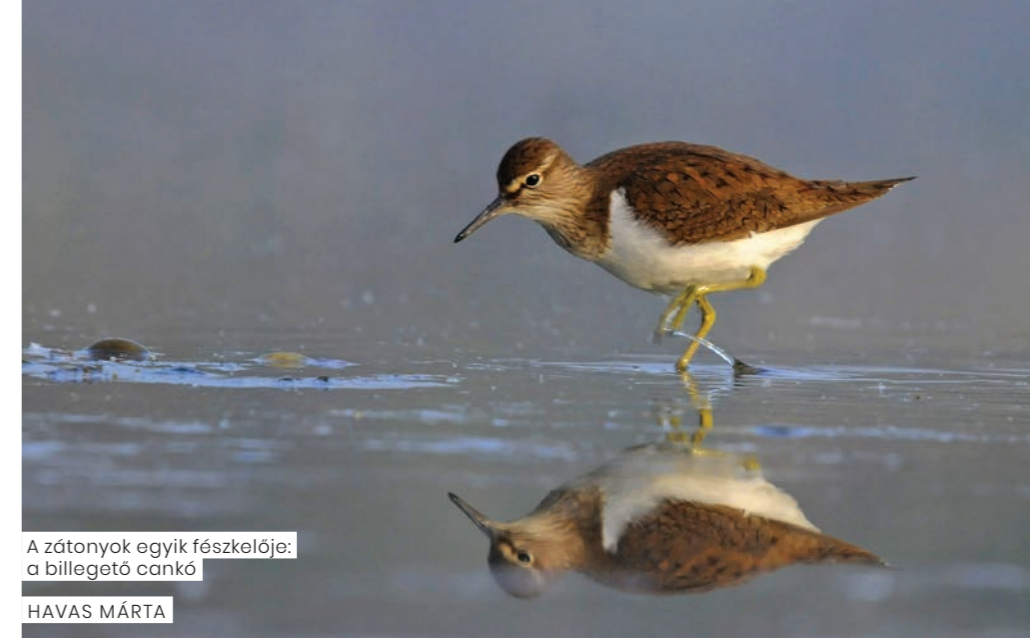
A zátonyok egyik fészkelője: a billegető cankó