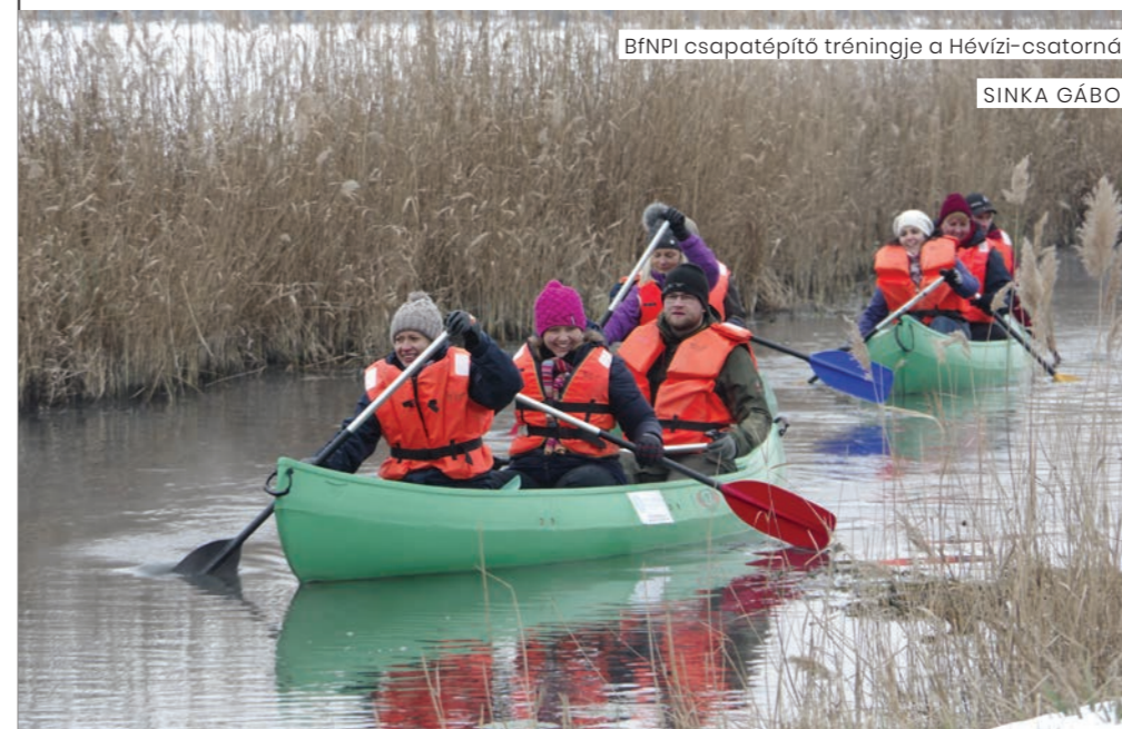
BfNPI csapatépítő tréningje a Hévízi-csatornán

Tehát a kezdőponton és a végponton egyaránt van a napnak olyan periódusa, ahol már vagy még nincsenek kenusok, vízitúrázóknak, így a telelő madarak nyugodtan, zavarásmentesen tudnak táplálkozni.