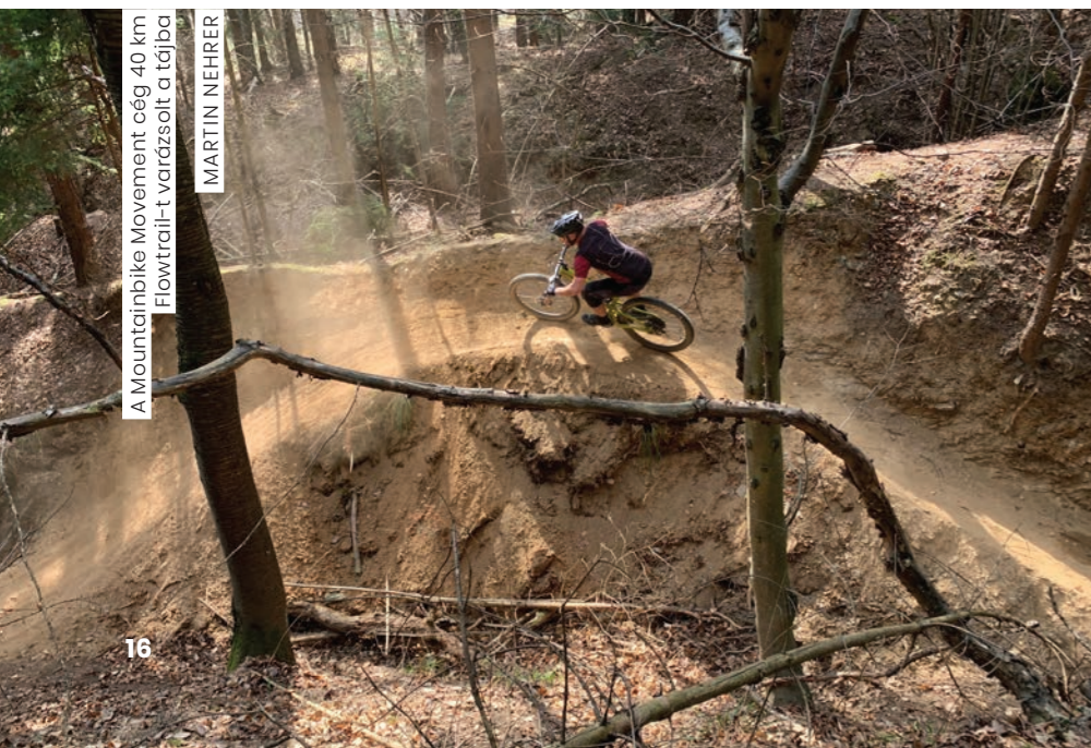
A Mountainbike Movement cég 40 km Flowtrail-t varázsolt a tájba

Hamarosan megkezdődtek a tárgyalások. Ezekon fontos szövetségeseink voltak a rohongi és lékai hegyikerékpárosok, akik a kezdetektől fogva támogatták a projektet. A hegység csúcsán az Írottktől sokszor le-