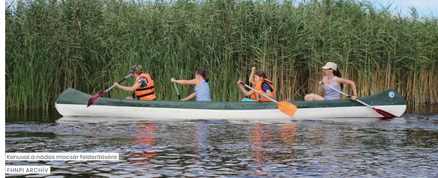
Kenuval a nádas mocsár felderítésére

Számtalan védett állatfajnak a táplálkozó-, szaporodó-, illetve búvó- és pihenőhelye, köztük több Natura 2000 jelölőfajnak. Ezért is tekintünk rá különös figyelemmel, mivel tudjuk, hogy a turisztikai hasznosí-