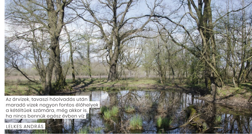
Az árvizek, tavaszi hóolvadás után maradó vizek nagyon fontos élőhelyek a kétéltűek számára, még akkor is, ha nincs bennük egész évben víz

A legnagyobb természeti értéket a halfauna képviseli: eddig 53 halfajt mutattak ki a Mura vízrendszeréből, amelynek nagyobb része védett, vagy fokozottan védett. A halak mellett a klasszikus ártéri élőhelyek és fajok jellemzőek, puhafás ligeterdőket találhatunk, jól érzi magát itt a fekete gólya és a rétisas. A zátonyok jellegzetes madara a kis lile és a billegető cankó. A hód is természetes úton visszatelepedett a vizek mentén. Sajnos az emberi tevékenység hatására az idegenhonos, behurcolt fajok is terjednek (özönnövények, jelzórak, nutria).