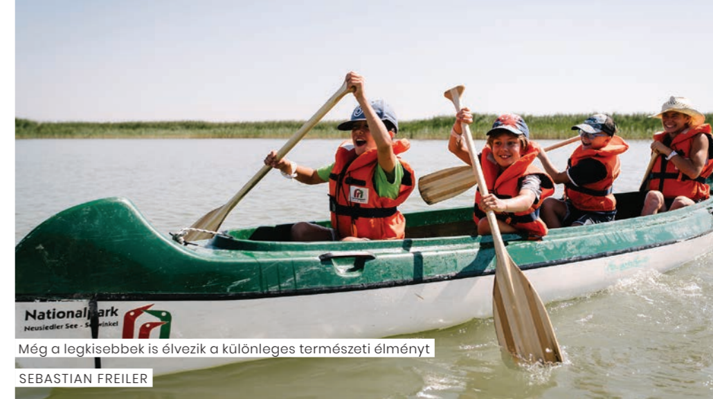
Még a legkisebbek is élvezik a különleges természeti élményt!

A védett területnek a regionális fejlesztésbe integrálása és a természet közvetítése szempontjából a belépődíjon és rövid túrán alapuló koncepciókat mindenképp kritikusán kell megítélni.