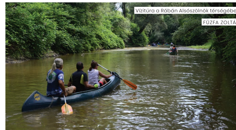
Vízitúra a Rábán Alsószőlőkné térségében

A túravezetők képzésébe integrálni kell a természetvédelmi ismereteket, amelyek kiterjednek a főbb természeti értékek bemutatására, a jogszabályok áttekintésére, valamint a vízitúrázással kapcsolatos természetvédelmi elvárások elsajátítására.