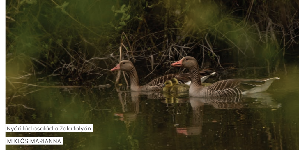
Nyári lúd család a Zala folyón

A Levegőben című nyitótéma a madarak élőhelyét és életformáját szemlélteti hangokat megszólaltató és a madárrepülés élményét felidéző VR-szemüveggel, illetve madárhatározóval. A mocsárvilághoz hátsó megvilágítású nádasfal ad alaphangulatot, a természetvédelem címermadara, a nagy kócsag itt jelenik meg, és megelevenedik az egykori kócsagór mindennapi élete is. Periszkópok segítségével a földbe és a mocsárba is betekinthetnek a látogatók. A vízi élővilágba járható üvegpadlóra installált interaktív fólián keresztül nézhetünk le. A Kis-Balaton területét, történelmét virtuális terepasztal is bemutatja. A szárazföld-