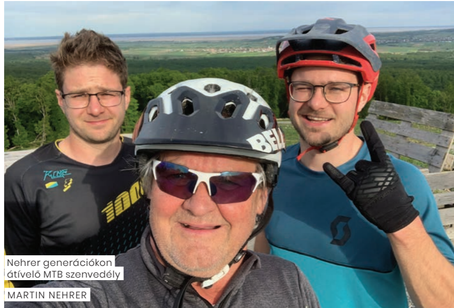
Nehrer generációkon átívelő MTB szenvedély