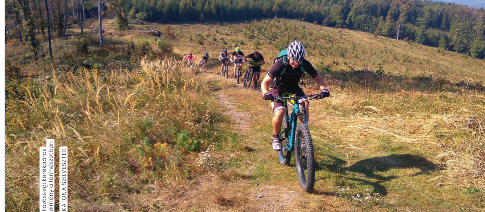
Közösségi kerékpáros élmény a természetben