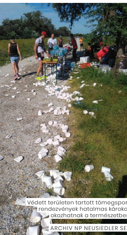
Védett területen tartott tömegsport rendezvények hatalmas károkat okozhatnak a természetben