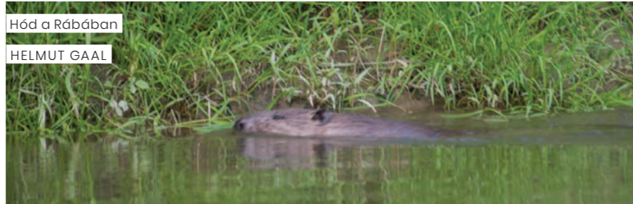
Hód a Rábában

Egy kenus vízitúra a Rábán minden korosztálynak felejthetetlen élmény. Különösen azok a vadregényes szakaszok tesznek nagy benyomást a vendégekre, ahol a folyó medre magas vízállásnál újra és újra átfurmálódik, és a kanyarulatok minden dagályt követően kissé megváltoznak. Csodálatos Ausztria és Magyarország között evezni úgy, hogy az országhatár nem is észlelhető.