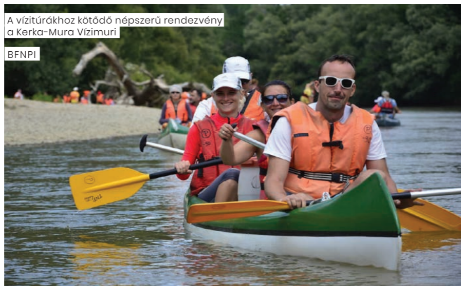
A vízitúrákhoz kötődő népszerű rendezvény a Kerka-Mura Vízimuri

A kirándulók nagyobb része tisztában van vele, hogy ezek a fajok természetvédelmi oltalom alatt állnak, így a virágszedést mára felváltotta a fotózás.