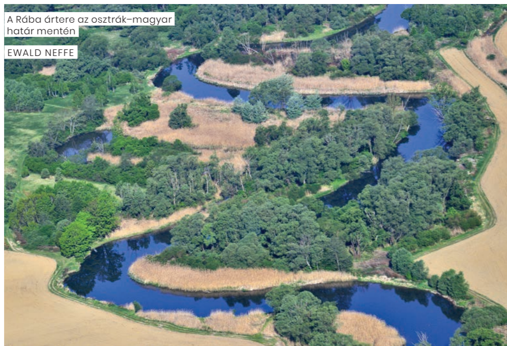
A Rába ártere az osztrák–magyar határ mentén

A kenutúrákat a régió szezonális kínálatához igazítottuk. A vendégek száma évről évre nő, már meghaladja a 2.000 főt is. Az AMS-sel (Foglalkoztatási Szolgálat) együttműködve a főszezonban idénymunkásokat alkalmazunk, így munkahelyeket is teremtünk. A tömegturizmust elkerülendő egyre többen keresik és válik mind népszerűbbé a természetturizmus, a vízi élmény iránti ke-