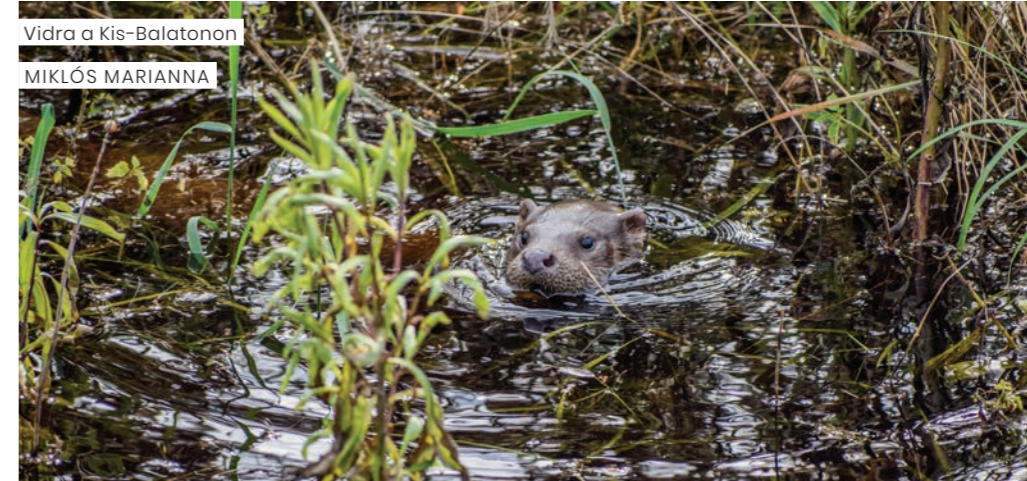
Vidra a Kis-Balatonon