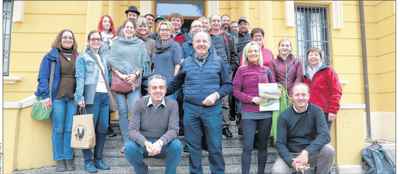
A térségi LEADER program helyi akciócsoportjánál tett látogatás során bemutatták az Európai Unió támogatásával megvalósult turisztikai marketingakciókat.

A szakmai út résztvevői több helyi termék-előállítással foglalkozó gazdaságba is ellátogathattak. Beteintést nyerhettek a családi hagyományokon alapuló növénytermesztés és