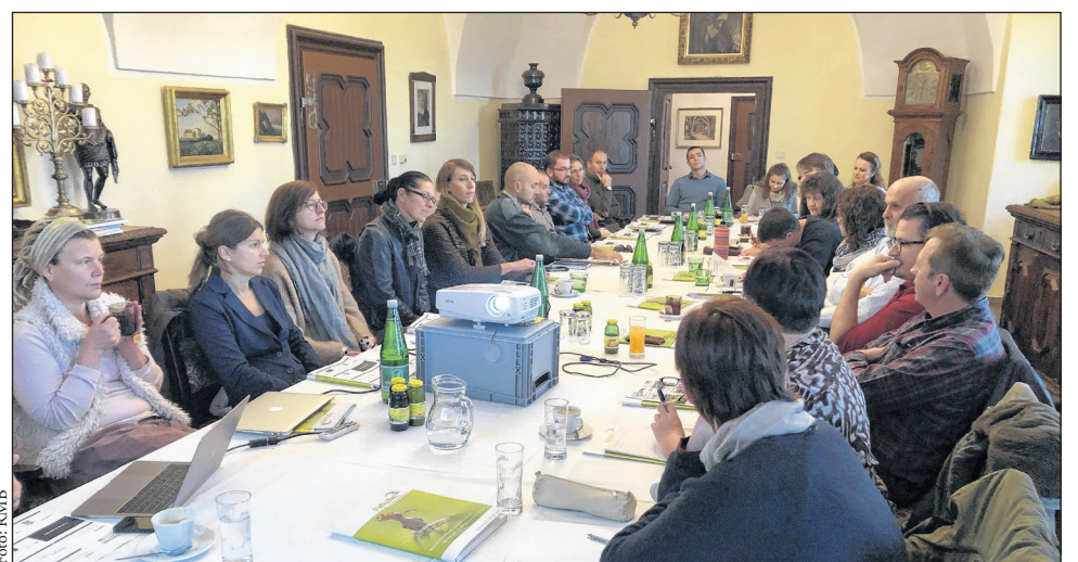
„Nátrpark műhelytalálkozó” workshop Weingrabenben.

A PaNaNet új, kétnyelvű szórólapja a közös marketingtevékenység további fontos eszköze. A brosúra a legfontosabb élőhelyek bemutatásán keresztül megismerteti a látogatókkal és az érdeklődőkkel a PaNaNetet, azaz a különleges védett területek hálózati együttműködését, és bepillantást nyújt Nyugat-Pannónia gazdag természeti örökségébe. Ezt kiegészítendő a szórólapon