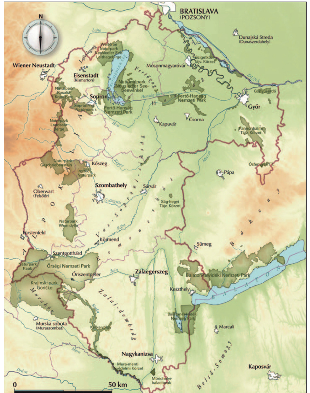
Nyugat-Pannónia védett területei