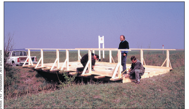
Ahol egészen az 1980-as évek végéig a vasfüggöny választotta el az embereket, 1994. április 24-re a nemzeti park munkatársai egy fahídat építettek.