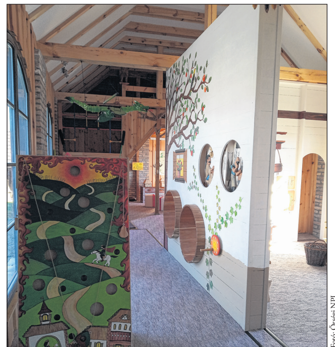
A ökoaktív élményközpontot művészi rajzok, grafikák teszi színessé, az ügyességi és szórakoztató játékok pedig garantálják a vidám hangulatot.

A nemzeti park reményei szerint az új létesítménnyel sikerül még vonzóbb helyszínné tenni a műemlék együttest a kisgyermekes családok számára is.