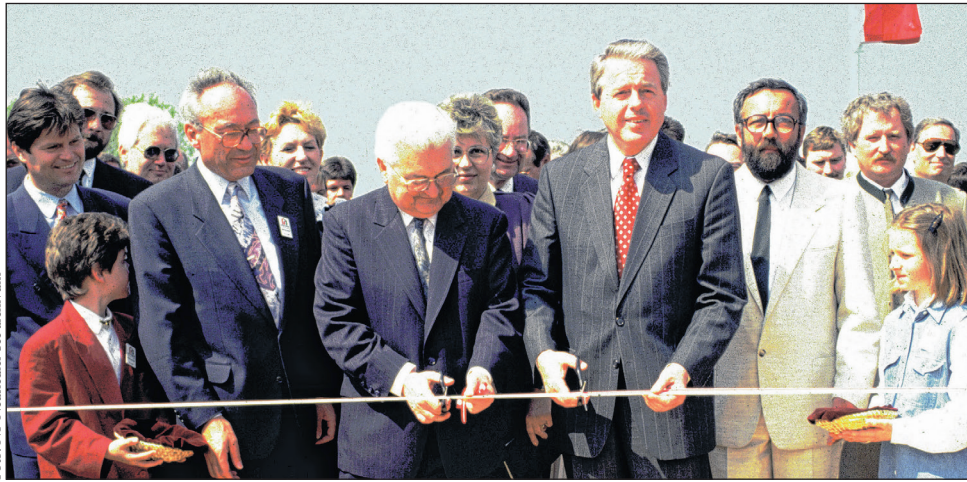
Egy, a határok fölött csak erre a napra létesített fahídon zajlott a két kormányfő, a környezetvédelmi miniszterek és nemzeti parki igazgatók részvételével a megnyitóünnepség.

A vasfüggöny formájában fennálló áthatolhatatlan politikai határ sokáig eltakarta a szemünk elől ennek a természetes határvidéknek a hihetetlen sokszínűségét. A Keleti-Alpok nyúlványai és a Kisalföld között egy északi, Adria-vidéki mediterrán és ázsiai jegyeket hordozó biológiai olvasztótégely terül el. Az itteni fajgazdagság a parti nádassal övezett sztyeppertől a szikes tavakon és legelőkön át a nedves rétekig és a hansági erdőig terjedő élőhelyek sokféleségének köszönhetően alakult ki. Ezen kívül a Fertő tó és közvetlen környéke a költöző madarak Európa és Afrika közötti egyik legfontosabb megállóhelye. Magyarországon és