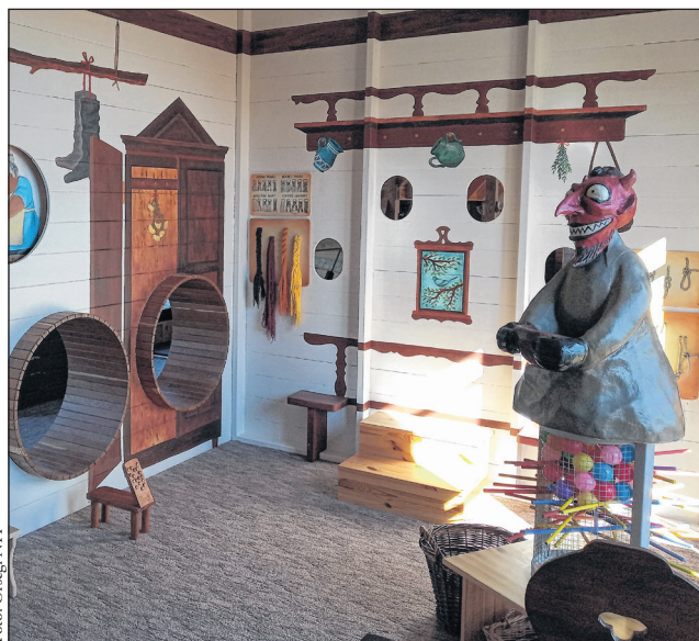
A mesebeli ördög feleségének konyhájában izgalmas játékok várják a kicsiket.

Új szolgáltatással bővül az Órségi Nemzeti Park Igazgatóság családbarát kínálati palettája. Tavasszal nyílik meg Szalafő-Pityerszeren, az órségi népi műemlék együttes fogadóépületében a természetismereti és népi hagyományok ökoaktív élményközpontja, vagyis az Élményközpont.