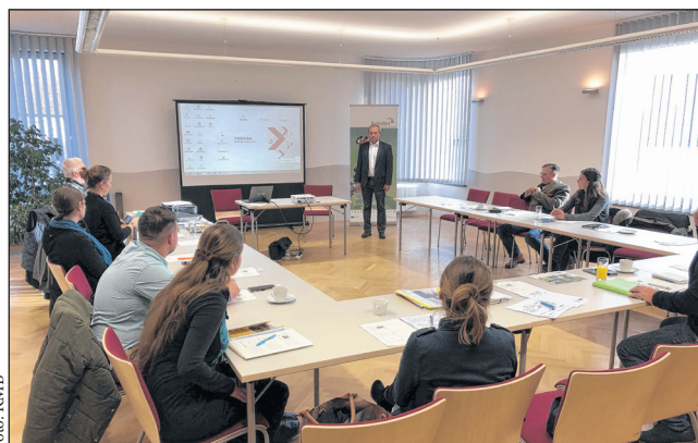
Természetvédelmi területeken dolgozó munkatársak továbbképzése „Facebook és közösségi média” témában.

szolgálja. A rendezvényen először a burgenlandi nátrparkok egyeztettek az aktualitásokról és a projekt keretében tervezett közös tevékenységeikről. Ezt követően csatlakoztak a magyar nátrparkok képviselői is a közös munkához.