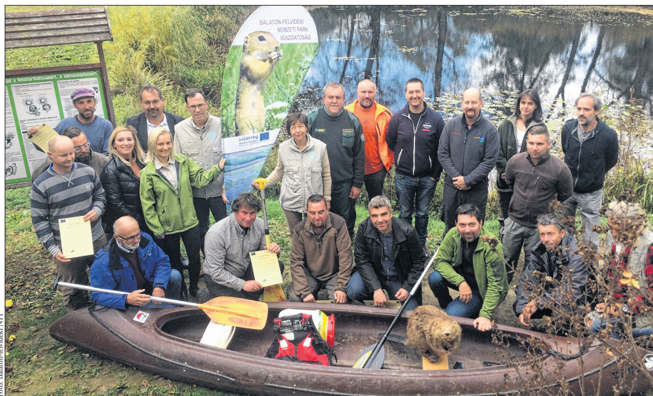
A vízi túravezető képzés keretében a résztvevők megismerkedhettek a vizes élőhelyek szakszerű bemutatásával.

A Balaton-felvidéki Nemzeti Park Igazgatóság egymásra épülő jelleggel bővíti a vízi turizmus kínálatát és javítja a szolgáltatás színvonalát. A vízi túrák biztonságos megvalósításához elengedhetetlenek a képzett túravezetők. Olyan szakemberekre van szükség, akik képesek a résztvevőket a túrára felkészíteni, a hatékony és kímélő evezési technikát, kormányzást betanítani. Az is elengedhetetlen, hogy a vízen kritikus helyzetben, borulás esetén a túravezetők hozzáértően lépjenek fel és garantálják a résztvevők biztonságát.