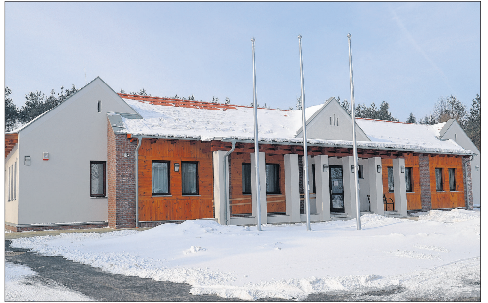
Az új Natura 2000 látogatóközpont egyben az igazgatóság székháza is lesz.

Ezen a helyzeten kívántunk változtatni fejlesztésünkkel, amely a Natura 2000 területeinket bemutató hálózat létrehozásával