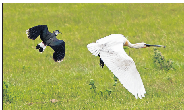
A nemzeti park számtalan madárfaj élőhelye – itt épp egy búbics riaszt fel egy kanalasgémet.

jellemző fajgazdasága miatt kimondottan attraktív célpont szakértők és tudósok körében, a képzési tevékenységek szintén jelentősen hozzájárulnak az ökoturisztikai sikerhez.