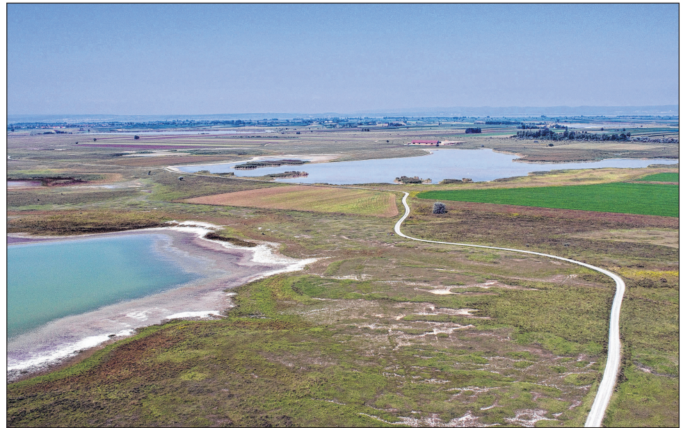
Szikes tavak, mint a Lange Lacke és a Wörthenlacke határozzák meg a táj arculatát.

nemzetközileg elismertté vált. A lakosság általi elfogadottságára a Fertőzugban könnyű választ adni: közel tízezer hektár védett terület több mint ezer család tulajdonát képezi, akik területük parlagon hagyásáért éves szinten pénzügyi kárpótlásban részesülnek a nemzeti park költségvetéséből. Ezen túlmenően a nemzeti park a helyi turizmus legmeghatározóbb márkájává nőtte ki magát, mely első sorban nemzetközi látogatókat vonz tavasszal és ősszel a térségbe. Az Európa egyik legjobb madármegfigyelődesztinációja „minősítést” a nemzeti park a megfelelő infrastruktúrának és a széles körű, egész éves programkínálatnak köszönhetően nyerte el. Európa „ablaka Ázsia felé”, továbbá az Alpok és a síkvidék közti átmenetre