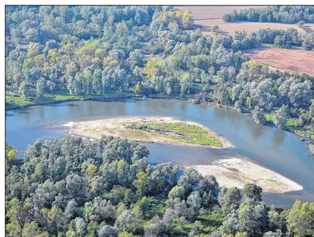
A vadregényes Mura határfolyó, emiatt eddig nehezen megközelíthető célpont volt a vízi turisták számára.

megkezdte kínálatfejlesztési programját. Első lépésként a PaNaNet projektben Muraszemenyén csónakház épült, ami a vízi túrák kiindulási pontja, illetve háromfős kenukat szereztek be. A projekt folytatásában vízi turisztikai helyzetfeltárás és termékfejlesztés történik, aminek eredményeként az egyes célcsoportokra szabott kombinált túrák készülnek el. A desztináció vízi túrázóik és a térségi lakosság körében való népszerűsítésére, a termék bevezetésére vízi fesztivált szerveznek. Mivel a folyó gyors sodrású és veszélyes víz, így a túrák biztonságos lebonyolításához túravezetőket képeznek ki nemzetközi sztenderdek alapján. A nemzeti park törekvései és tevékenységei által a Mura folyó és térsége néhány éven belül bekerülhet a nemzeti és nemzetközi vízi turisztikai célpontok sorába.