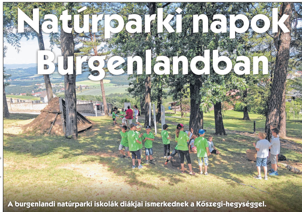
A burgenlandi natúrparki iskolák diákjai ismerkednek a Kőszegi-hegységgel.

TÖBB MINT 400 GYERMEK FEDEZTE FEL A GESCHRIEBENSTEIN – ÍROTT-KŐ NATÚRPARKOT. – A Regionalmanagement Burgenland szervezésében második alkalommal kerültek megrendezésre a natúrparki napok a „PaNaNet+” projekt keretében. A rendezvény során több mint 400 gyermek, köztük 14 natúrparki iskola diákjai, 2 natúrparki óvoda növendékei, valamint egy magyar általános iskola diákjai fedezték fel a Geschriebenstein (Írott-kő) Natúrpark különlegességeit. Lehetett szó akár denevérekről, énekesmadarokról, a gyerekek nagy lelkesedéssel vettek részt a programokon. Július 12-én és 13-án