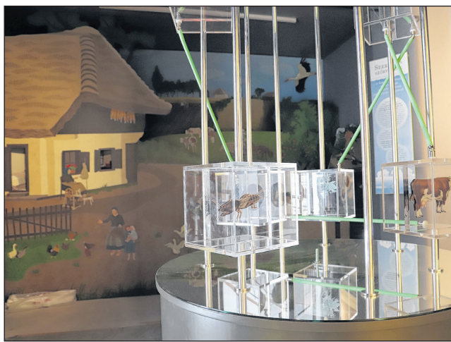
A természeti értékeket látványos kiállítás mutatja be.

terméket vagy szolgáltatást. Így próbáljuk hangsúlyozni a természet ezen darabjainak ökoszisztéma szolgáltatásait és a belőlük élő közösségek jelentőségét. A tornyok alsó részében számítógép és hozzá kapcsolódó monitor található, amelyen a helyes gazdálkodási gyakorlat, igazgatóságunk tevékenységével kapcsolatos ismeretterjesztő rövidfilmek nézhetőek meg.