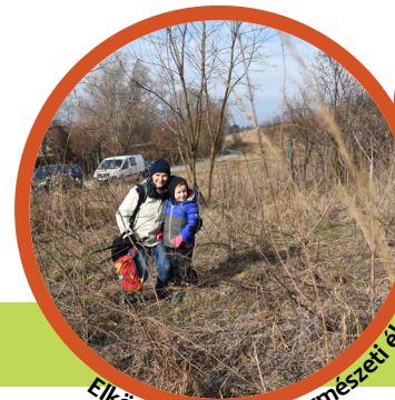
Elkötelezettség és természeti élmény

Tipp: Ha a gondozási tevékenységeket az iskolákkal és óvodákkal együtt valósítják meg, már a legkisebbek is megismerkedhetnek a természetvédelmi munkával. Ez a szülők és nagyszülők számára is megkönnyíti az önkéntes munkába való bekapcsolódást.