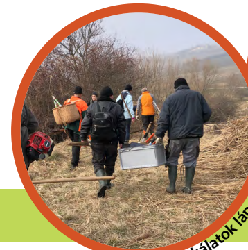
Gondozási munkálatok lábon