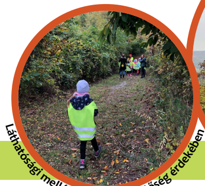
Láthatósági mellény az észrevehetőség érdekében

Tipp: Kiemelkedő programpont lehet a regionális termékek kóstolása.