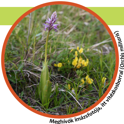
Meghívók imázsforója, itt vitékosborral (Orchis militaris)

Ajánlott információk az önkéntes akciókra való meghívókhöz: