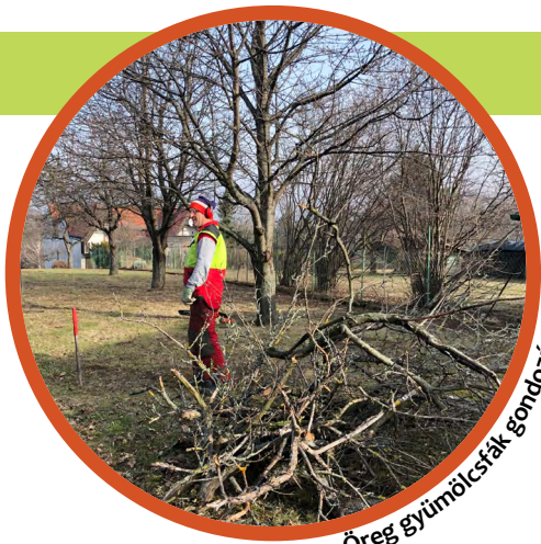
Öreg gyümölcsfák gondozása