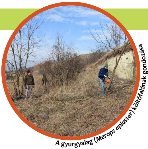
A gyurgyalag ( Merops apiaster ) költőfalának gondozása