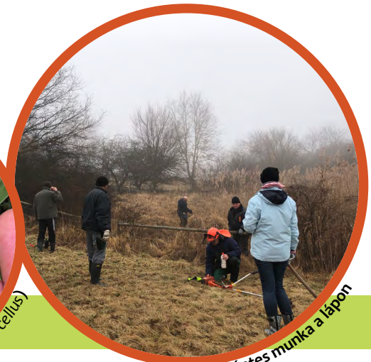
Önkéntes munka a lápon