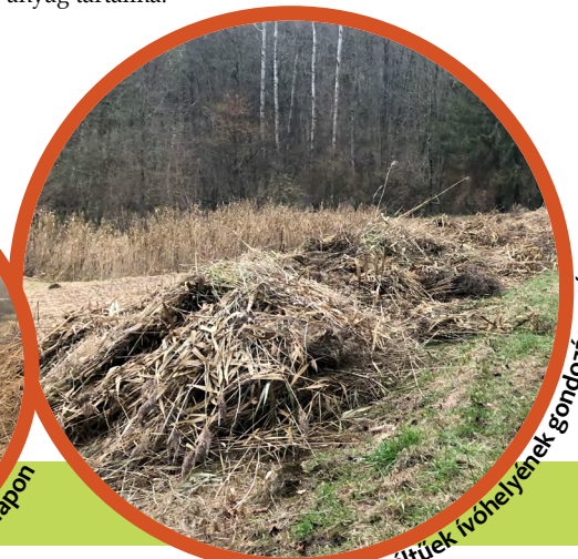
Nádvágás kétéltűek élőhelyének gondozása után.