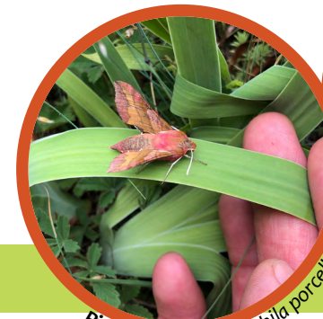
Piros szender (Deilephila porcellus)

Az önkéntesek bevonása ezért nagy jelentőséggel bír az alkalmazott faj- és élőhelyvédelemben. Saját munkájuk hozzájárulásával fokozott figyelmet fordítanak a védendő élőhelyekre és érzelmileg is jobban kötődnek.