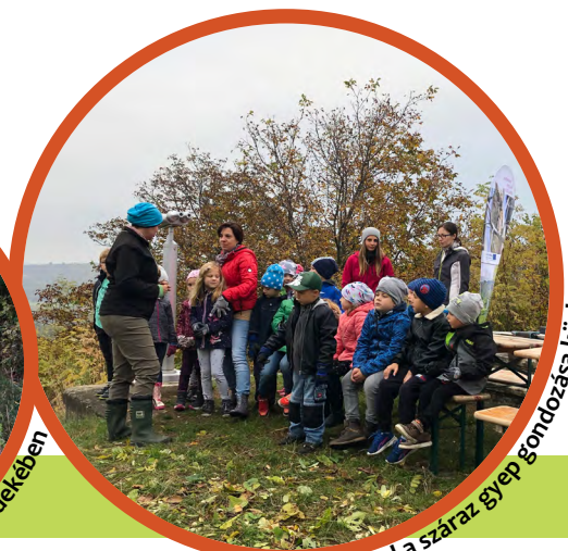
Osztály kísérelőkkel a száraz égyep gondozása közben