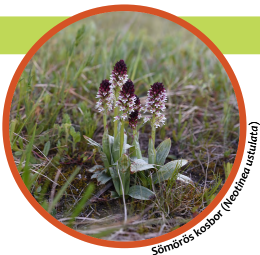
Sömörös kosbor ( Neotinea ustulata )

Az önkéntes akciók nemcsak a védelemre érdemes élőhelyek kezelését szolgálják, hanem a résztvevők faj- és élőhelyvédelmi tudatosságának növelésében is nagy lehetőséget rejtene. Ahhoz, hogy ezt a potenciált ki lehessen használni, a természeti nevelés formáját a célcsoportnak megfelelő módon kell átgondolni és megvalósítani.