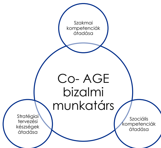
1. ábra: Átfogó célkitűzések

A „Co-AGE bizalmi munkatárs” tréning elsajátítása során a résztvevők átfogó ismereteket szereznek a projekt szempontjából releváns területeken. A képzés során lehetőség nyílik egy saját kisprojekt megtervezésére, amely alapként szolgálhat annak későbbi megvalósításához. Az elméleti alapokon nyugvó, ámde gyakorlatorientált „Co-AGE bizalmi munkatárs” workshop átfogó célkitűzései a következők: