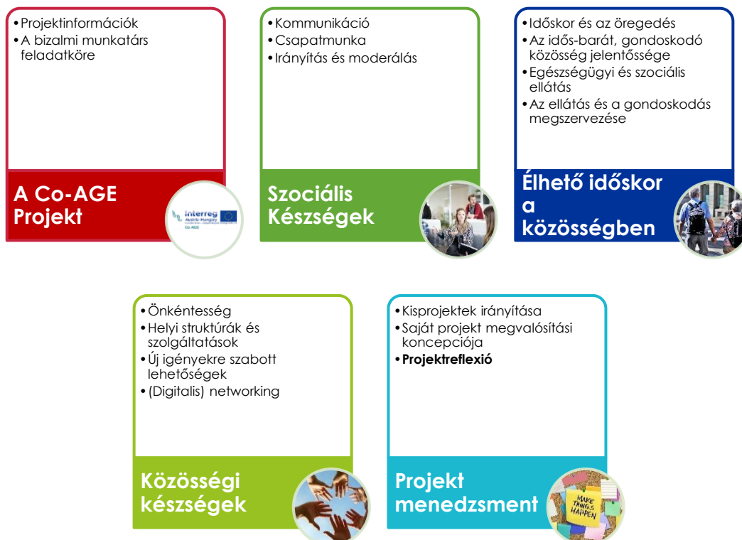
3. ábra: Modulok