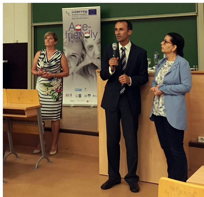
Medieninhaber und Herausgeber: Projekt „Age-friendly Region“ Chance B Firmengruppe, Franz-Josef Str. 3, 8200 Gleisdorf www.chanceb-gruppe.at

Das Vereinigte Institut für Gesundheitswesen und Soziales Győr (EESZI), Chance B aus Österreich, das European Centre for Social Welfare Policy and Research (Wien), das Szombathelyer Pálos Károly Sozialdienstleistungszentrum sowie das Zalaegerszegeger Betreuungszentrum nehmen als Partner am Projekt teil. Die grenzüberschreitende Kooperation ermöglicht es, dass die Fachleute beider Länder unter Anwendung ihres Wissens und ihrer Erfahrungen gemeinsam ein Modell für die an der Umsetzung beteiligten Organisationen ausarbeiten, mit dessen Hilfe die in Österreich und Ungarn wohnenden älteren Menschen so lange wie möglich selbständig und autonom in ihrer gewohnten Umgebung leben können. Zur Verwirklichung dieses Ziels wird eine neue Dienstleistung – das Case Management für ältere Menschen – mit einem gemeinsamen Konzept angeboten. Dabei werden in den fünf Projektregionen Erkenntnisse gewonnen, die in die Planung und Steuerung der regionalen Gesundheits- und Sozialsysteme rückwirken sollen. ■